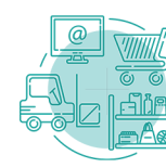
Wirtschaft / Verwaltung

gemäß §§ 66 BBiG / 42r HwO (Besondere Regelungen bzgl. Behinderungen) und §§ 4 BBiG / 25 HwO (Regelausbildung)